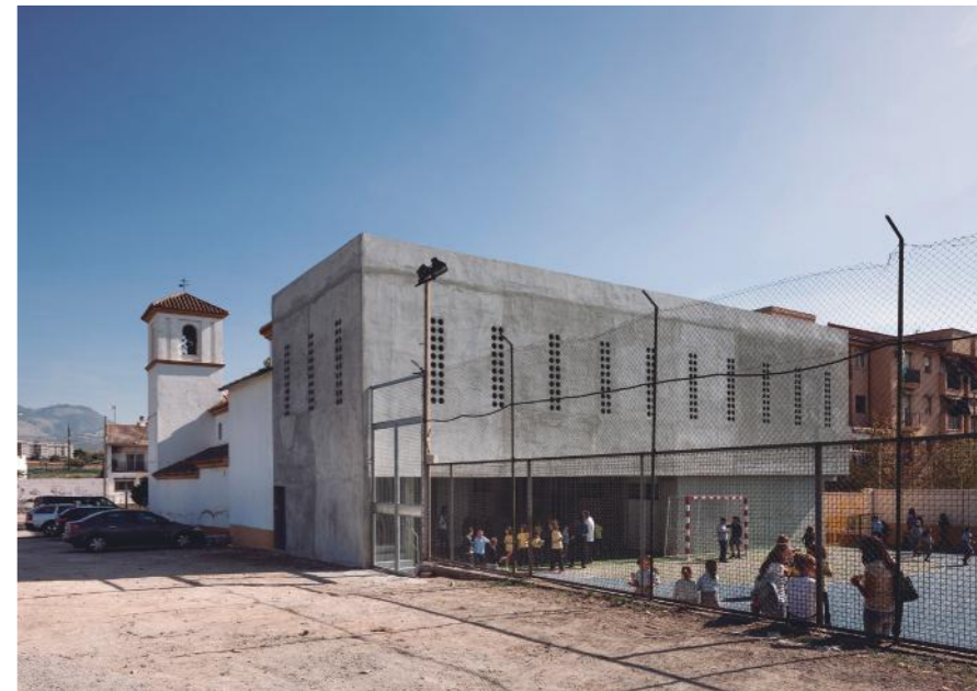
Foto: Espacio de usos múltiples en la escuela Cerrillo de Maracena en Granada. Fernando Alda

Por otro lado, ¿considera que se está innovando y consolidando una nueva