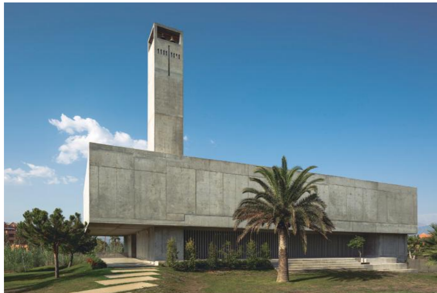
Foto: Iglesia en Playa Granada.

Desde la creación del primer refugio, la arquitectura ha tenido cientos de definiciones, ¿cómo la definiría usted actualmente? ¿Por qué es importante para el hombre?