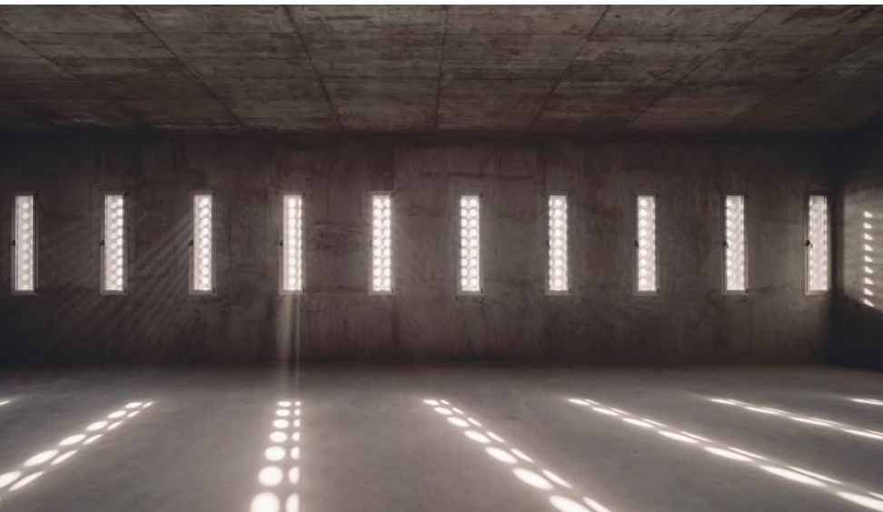
Foto: Espacio de usos múltiples en la escuela Cerrillo de Maracena en Granada. Fernando Alda

En este sentido, ¿cómo debería ser la formación de los nuevos arquitectos? ¿Responden las universidades a las demandas de la profesión?