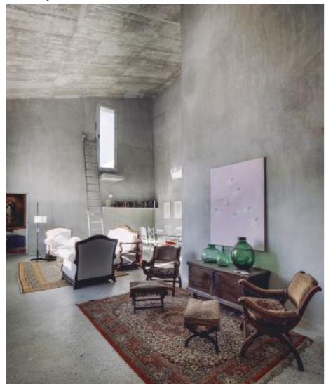
8 viviendas experimentales en el Realejo en Granada.

y el entorno físico donde ésta se desarrolla. La nueva arquitectura en España es propositiva con muchos ejemplos de una gran calidad.