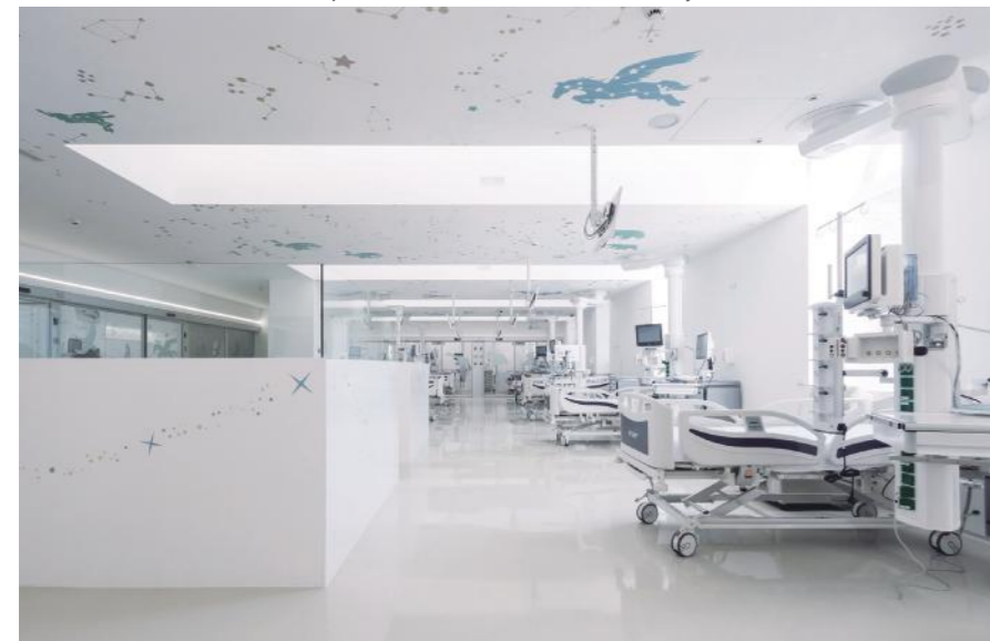
Foto: Remodelación de la UCI del Hospital Niño Jesús en Madrid. Ricardo Santonja

“Procuro que mis obras resuelvan los problemas arquitectónicos con coherencia y de la forma mas precisa posible...”