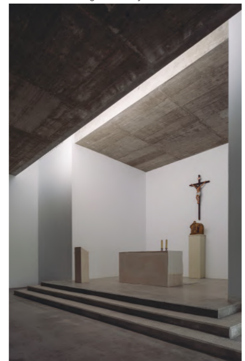
Foto: Iglesia en Playa Granada.

Procuro que mis obras resuelvan los problemas arquitectónicos con coherencia y