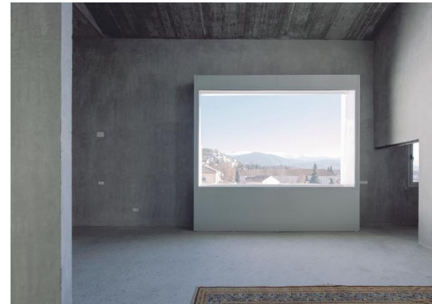
Foto: 8 viviendas experimentales en el Realejo en Granada.

La luz es la gran protagonista, la materia intangible que cualifica el espacio. Arquitectura es el arte de domesticarla, filtrarla o dirigirla.