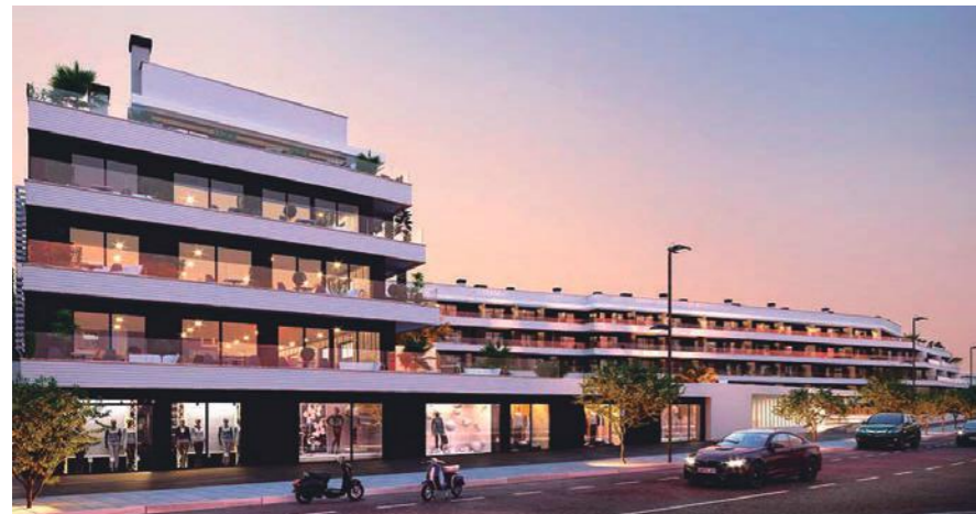
Foto: Complejo Residencial Onyx, Ibiza, España

La arquitectura es una forma de transmitir creatividad, un modo de interpretar la pasión, la fusión entre técnica y arte. Nuestros clientes nos asocian a una empresa capaz de crear proyectos icónicos, que inspiren a las ciudades y participen de su identidad cultural. El origen de la vida, de cada esencia viva es lo que nos hace únicos. DNA representa una arquitectura icónica. De alguna manera, para nosotros cada proyecto tiene alma propia. Intentamos ser una especie de puente entre la identidad del cliente y sus sueños. La esencia de nuestro trabajo es poder conectar con las personas.