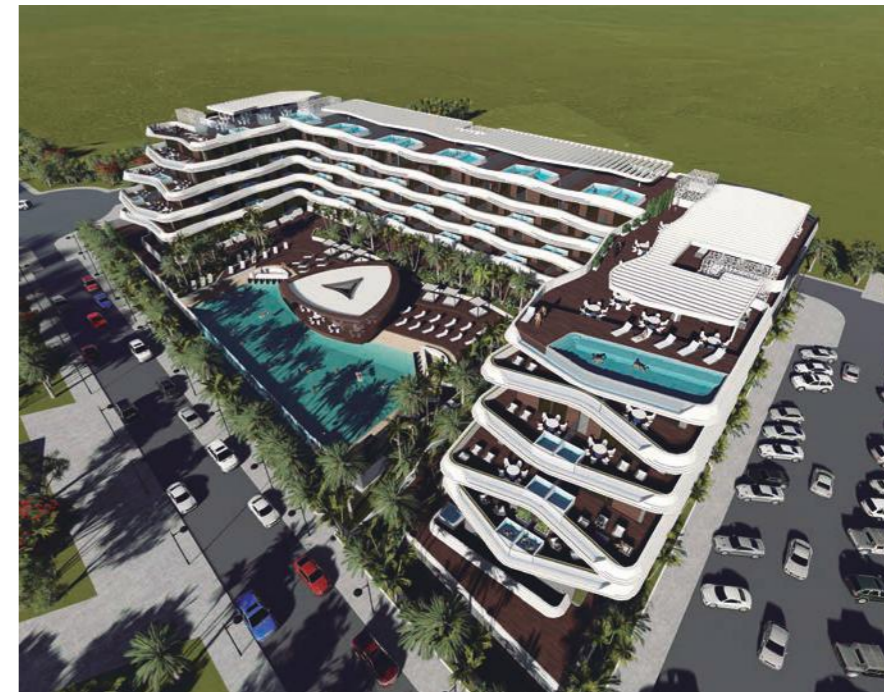
Foto: Complejo Residencial The Waves, Ibiza España

Aspectos técnicos: la solidez técnica del proyecto y el uso de las mejores alternativas técnicas disponibles.