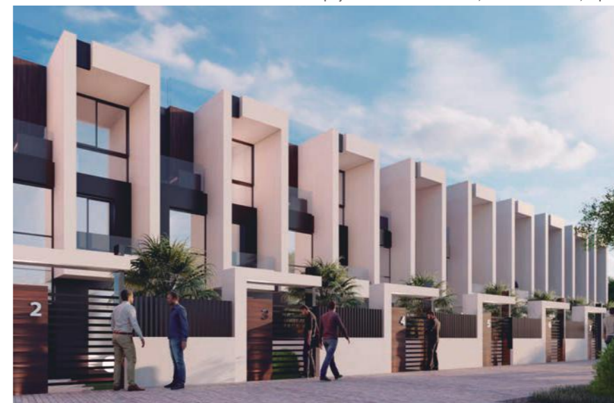
Foto: Complejo Residencial 10 viviendas, Vilanova i la Geltrú, España

Y, en este aspecto a esto, ¿cómo definirían con una sola palabra su arquitectura? ¿Por qué?