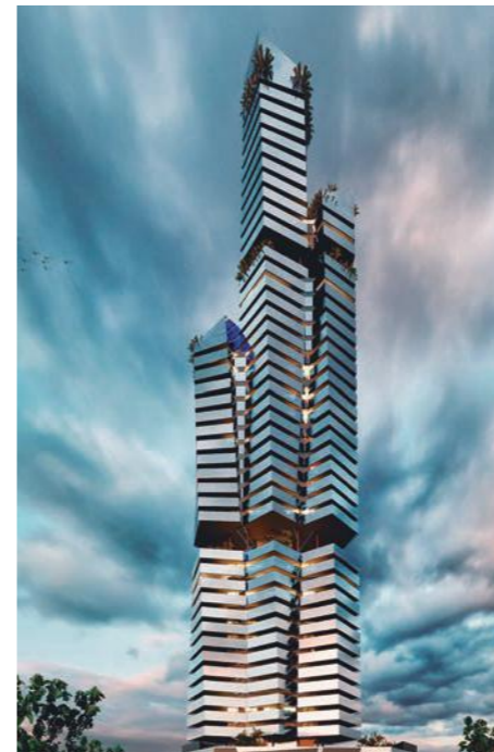
Foto: Kryptonite Tower, Calpe, España

DNA se centra en crear un equilibrio entre los habitantes, la ciudad y el medio ambiente. El diseño se basa en generar la máxima interacción entre el edificio y su entorno.