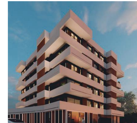
Foto: Complejo Residencial 40 viviendas, Vilanova i la Geltrú, España

En cuanto a DNA, estamos inmersos en los proyectos residenciales (complejos, casas, hoteles...) tanto como torres, hospitales y escuelas. Para nosotros el futuro significa la innovación. Siempre buscamos una fuerte relación entre "arquitectura" e "innovación" mediante el uso ingenioso de materiales locales dentro del proceso de diseño, así como el compromiso de la tecnología con la arquitectura en escalas adecuadas a través de un análisis. Consideramos el concepto de innovación como una actitud holística en relación con los proyectos del futuro.