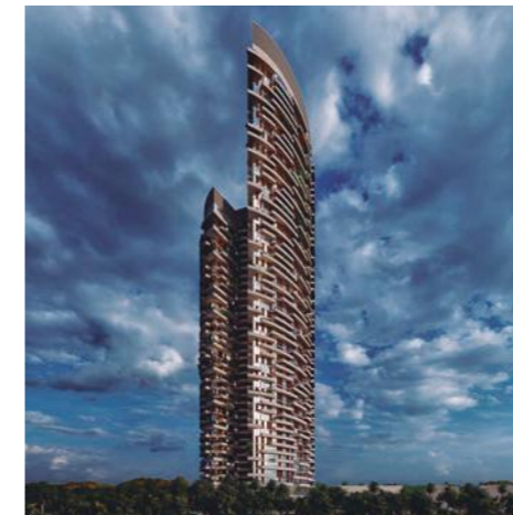
Foto: Hanging Gardens, Miami, Estados Unidos

La arquitectura es un gran arte, contiene miles de otras artes, ciencias y conocimientos. La tarea de crear y garantizar un entorno de vida digno y sostenible para una persona sigue siendo una tarea permanente. Por eso los arquitectos deben cumplir con las leyes que rigen sus actividades profesionales y deben sopesar cuidadosamente las consecuencias sociales y el impacto ambiental de sus actividades profesionales. Los arquitectos han de respetar el sistema de valores, el patrimonio natural y cultural de la sociedad en la que crean sus obras y a contribuir a la preservación y mejora de los valores culturales de la sociedad.