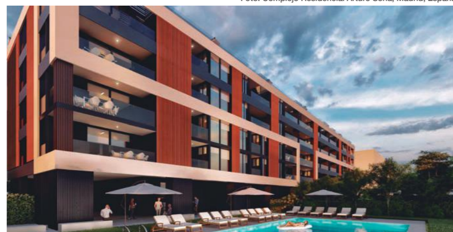
Foto: Complejo Residencial Arturo Soria, Madrid, España

Sí, absolutamente. Estamos desarrollando los proyectos para diferentes países tal como Estados Unidos, Argelia, México, U.A.E, Rusia, Kuwait... La internacionalización nos permite crecer, ampliar el mercado y, por lo tanto, obtener un mayor volumen de negocios aportando los beneficios no solo para la empresa sino para la sociedad en general. Además, la internacionalización de la arquitectura permite algún tipo de intercambio, la Unidad, debido a las conexiones globales y la tecnología mundial, se abre paso en todos los países culturales a través de las