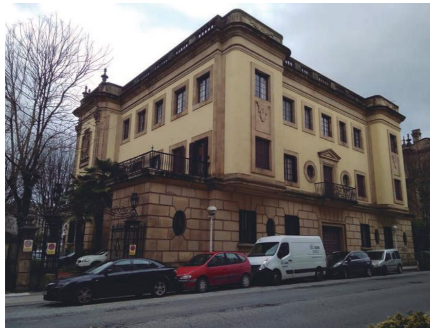
Foto: Hotel 4 estrellas en Palacio Vastameroli, San Sebastián

Por otro lado, estamos finalizando las obras de rehabilitación del Palacio Vastameroli de San Sebastián para destinarlo a Hotel****. Seguramente ésta será nuestras últimas obras.