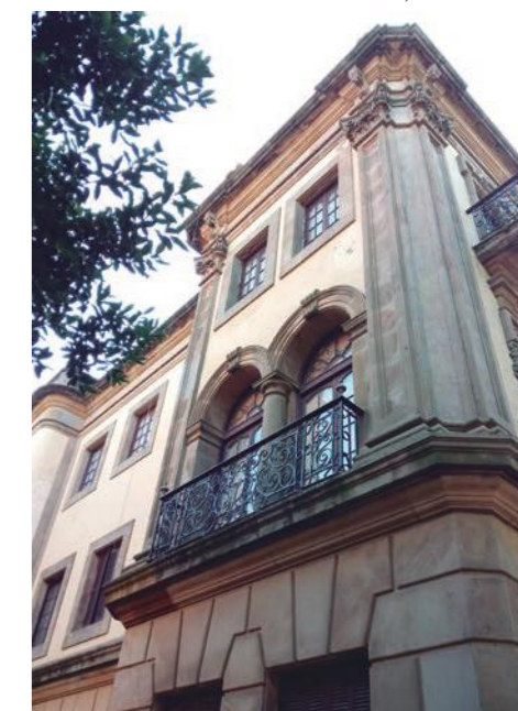
Foto: Hotel 4 estrellas en Palacio Vastamerol, San Sebastián

La internacionalización puede conseguirse a través de concursos o de la mano de