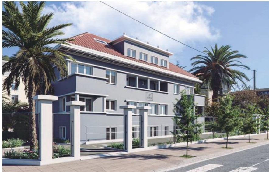
Foto: Playa Gros Apartments, San Sebastián

un promotor. Nosotros lo conseguimos eventualmente los años anteriores a la crisis, de la mano de la misma cadena hotelera para la que seguimos trabajando, pero en el año 2009 todos, promotores y arquitectos, volvimos a los cuarteles de invierno. Es muy difícil mantenerse en el exterior. Es un problema de escala y nosotros no hemos llegado a alcanzarla. Solo los grandes nombres de la arquitectura y las grandes ingenierías lo consiguen y aun así muchos perecen en el intento.