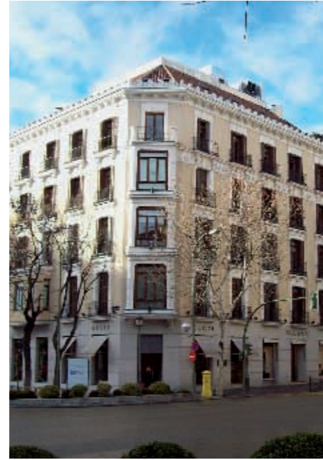
Foto: Calle Serrano, Madrid

El Ministerio de Agricultura, Alimentación y Medio Ambiente (MAGRAMA), puso en marcha el pasado año, y a lo largo de todo este 2014, el Plan de Impulso al Medio Ambiente PIMA SOL, una iniciativa destinada a la reducción de las emisiones de gases