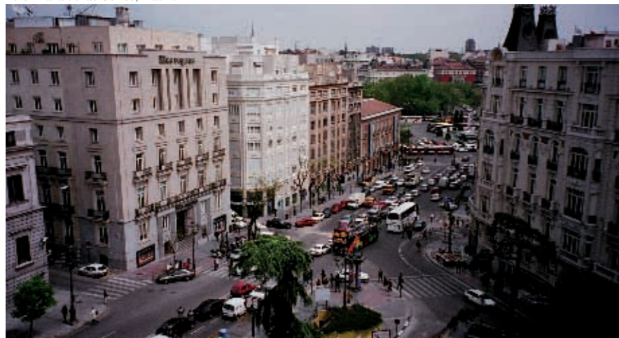
Foto: Plaza de las Cortes, Madrid

se ayudará bajo la modalidad de préstamo reembolsable.