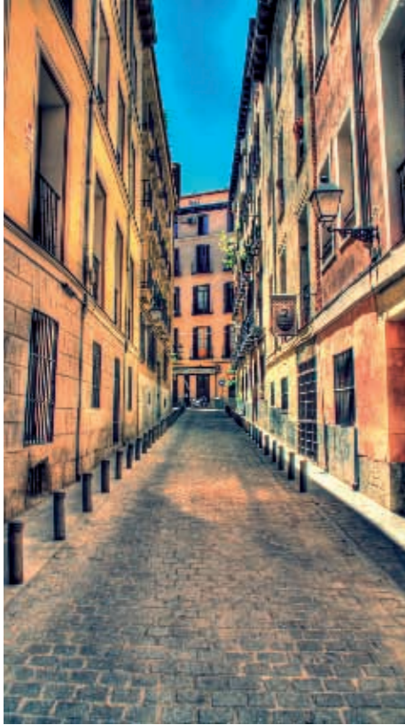
Foto: Calle del Lazo, Madrid

Inversiones (BEI). Este fondo financiará todas las inversiones directamente relacionadas con el aumento de la eficiencia energética y la utilización de energías renovables en entornos urbanos, y es compatible con otras fuentes de