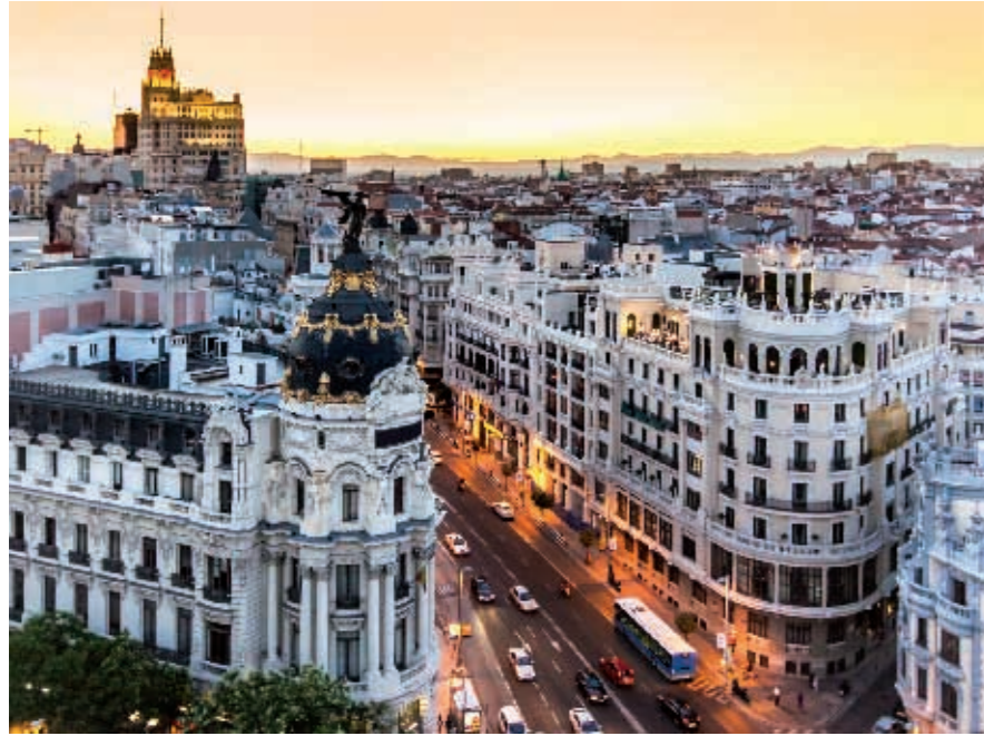
Foto: Calle Gran Vía, Madrid

horizontal y las empresas de servicios energéticos.