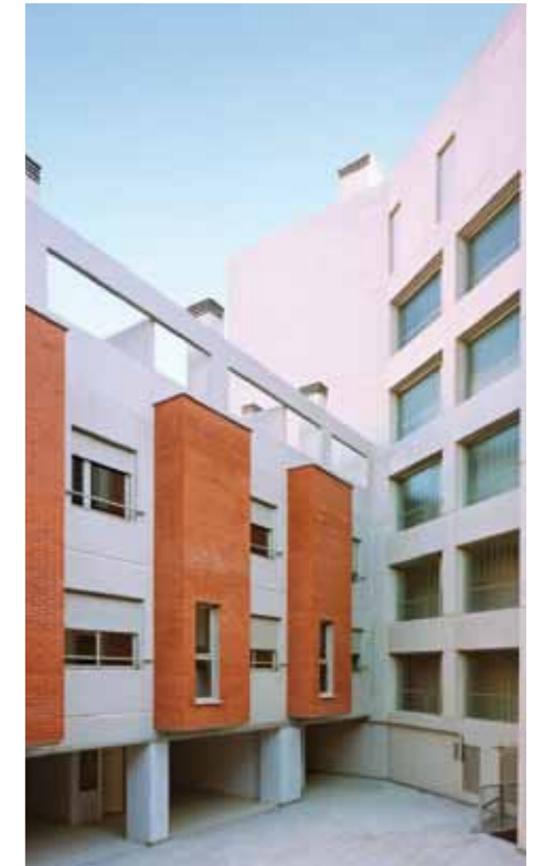
Foto: 21 Viviendas Calle Eraso (Madrid)