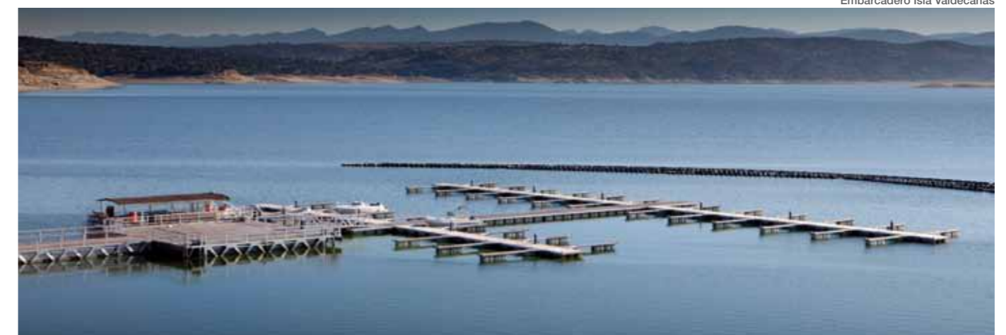
Embarcadero Isla Valdecañas

Esta compuesto por dos cuerpos articulados, distintos en tamaño, formas y texturas. El menor, formado a su vez por otros tres