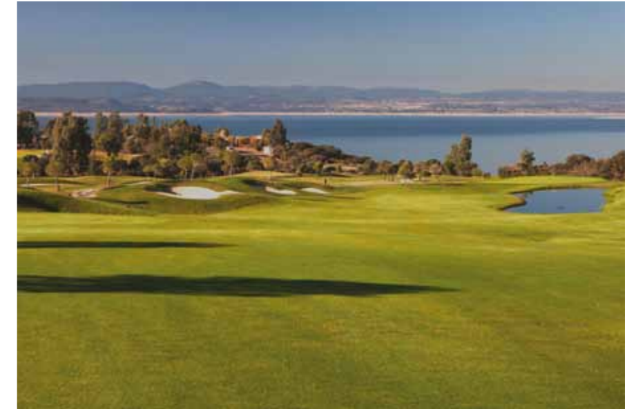
Campo de Golf Valdecañas

Actualmente se han ejecutado la urbanización general, las instalaciones deportivas, la primera fase del puerto deportivo, el campo de golf, el hotel del golf y casa club, el club social de las villas con las piscinas y la laguna con la playa artificial y 185 villas. Está en ejecución el hotel Medical SPA. Las villas tienen una sola planta de altura y algunas tienen sótano con patios de luces interiores y patios ingleses. El hotel del golf tiene tres plantas, incluida la baja. El hotel Medical SPA