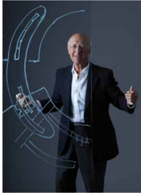
Arquitecto: Miguel Ángel Gea Andrés

Compositivamente se ha optado por resaltar un volumen prismático rotundo de una altura, que contiene la segunda planta de habitaciones, que vuela por todos los lados sobre la planta primera, también de habitaciones. El basamento lo constituye la planta baja, de uso social, cuyo volumen se articula en su encuentro con el cuerpo de acceso orientándose hacia el sur, buscando las buenas vistas para disfrutarlas desde el salón-bar.