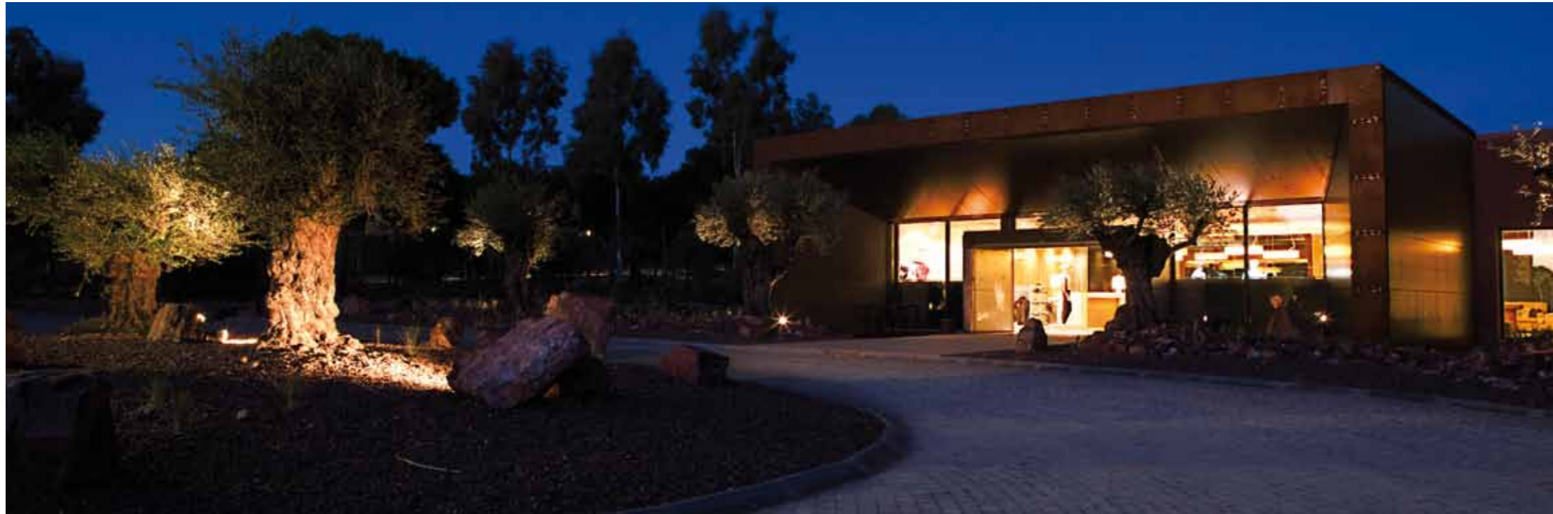
Entrada Hotel Husa Golf Valdecañas

El entorno exterior del edificio se caracteriza por tener una jardinería que configura un paisaje natural poco urbanizado con especies autóctonas de encinas, pinos y matorral de monte bajo, con jaras, romero, retama y lentiscos, al que se le han incorporado distintas especies de gramíneas junto con olivos de gran porte. Para evitar un carácter urbano, las zonas ajardinadas en contacto con el edificio no se han pavimentado, excepto la zona del acceso principal. El resto se ha cubierto con grava suelta de cuarcita con elementos singulares de piedras muy grandes.