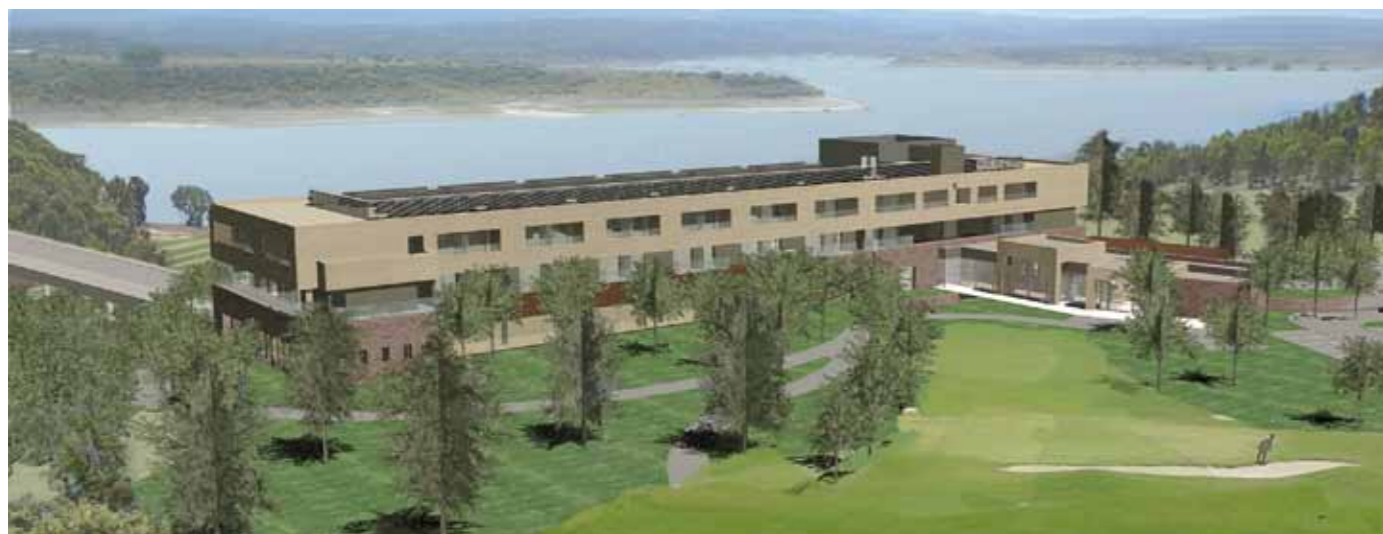
Infografía Hotel Husa Golf Valdecañas

volúmenes, todos de una sola planta pero con diferentes alturas, contiene el hall de entrada, con la recepción unificada para el hotel y el club de golf, la tienda del club de golf, diferenciada para señoras y caballeros a ambos lados del acceso, de paso obligatorio e integrada en el hall, y el cuarto de palos.