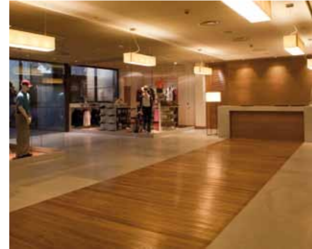
Recepción Hotel Husa Golf Valdecañas

Interiormente las paredes y los falsos techos son de cartón yeso y están pintados en diferentes tonos en consonancia con el carácter y tipo de uso de cada espacio. En los locales de pública concurrencia, los falsos techos son especiales para lograr unas condiciones acústicas y obtener un determinado confort. Los pavimentos del hall de entrada, del foyer de las salas de usos múltiples y de las escaleras de clientes son de mármol blanco de Macael. En el hall y en el