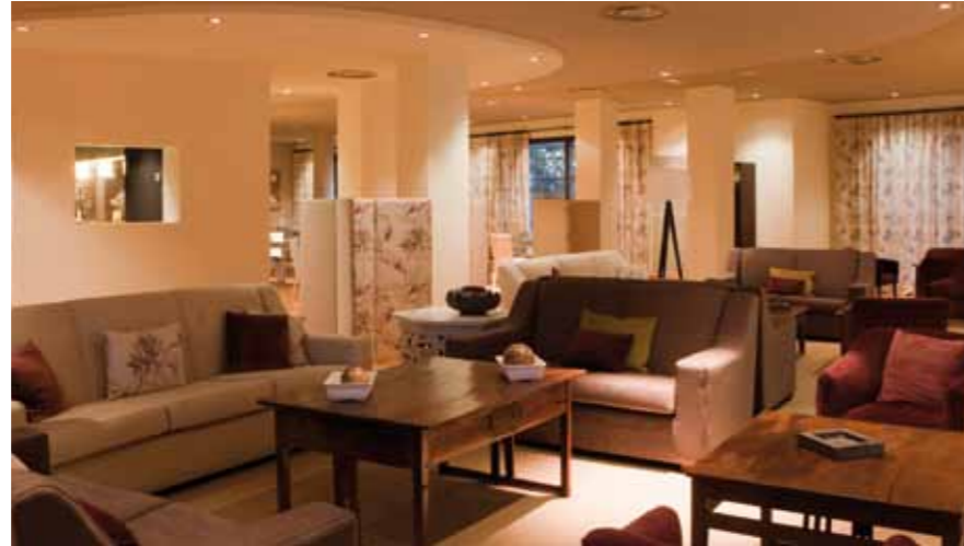
Interior Hotel Husa Golf Valdecañas

Compositivamente se ha optado por resaltar un volumen prismático rotundo de una altura, que contiene la segunda planta de habitaciones, que vuela por todos los lados sobre la planta primera, también de habitaciones. El basamento lo constituye la planta baja, de uso social, cuyo volumen se articula en su encuentro con el cuerpo de acceso orientándose hacia el sur, buscando las buenas vistas para disfrutarlas desde el salón-bar.